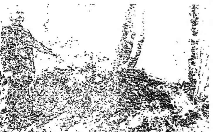
والد الطفل القليل بشر ان مكان تعذيبه قاتل ابنه واطاحته